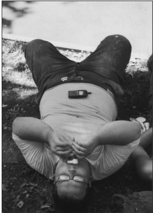
Wacheschieben kann ganz schön anstrengend sein!

Fazit: Kulturell sowie auch zwischenmenschlich war das Camp in diesem Jahr wirklich schön, wenn auch etwas schwach besetzt. Die öffentlichen Aktionen hätten m.M. qualitativ besser sein können und ein paar mehr hätten auch nicht geschadet. Politisch betrachtet war es eher ein Mißerfolg, weil es uns nicht gelang, uns der Vertreibung durch die Stadt Weimar erfolgreich zu widersetzen. Aber: nächstes Jahr kommen wir wieder!