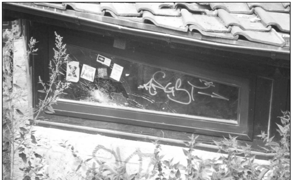
Bis alles wieder in Scherben fällt?

Endresultat dieser großen Gesprächsrunde war: „Alle könnten sich in Halberstadt frei und unbesorgt bewegen. Alle Plätze und Straßen sind sicher.“ und „Die Kürzungen