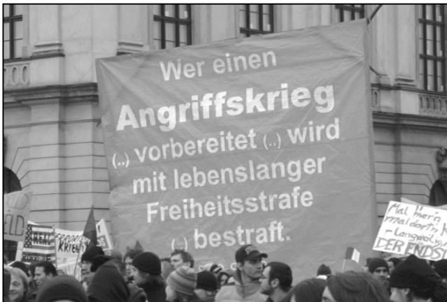
Demo am 15.2. in Berlin

sequent und halbherzig zu sein, wenn man bedenkt, dass sie den US-Streitkräften gewährt, u.a. das Hoheitsgebiet der Bundesrepublik Deutschland zu überfliegen. Diese Gewährung wäre der Bündnispflicht geschuldet, behaupten die verantwortlichen