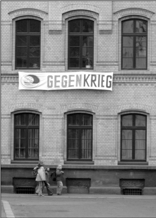
Transpi an einer Buckauer Schule

den Kriegen mit deutscher Beteiligung - recht ausführlich noch über die kleinste Aktion - auch aus den umliegenden Kleinstädten - berichtet und fast täglich kriegskritische Leserbriefe veröffentlicht.