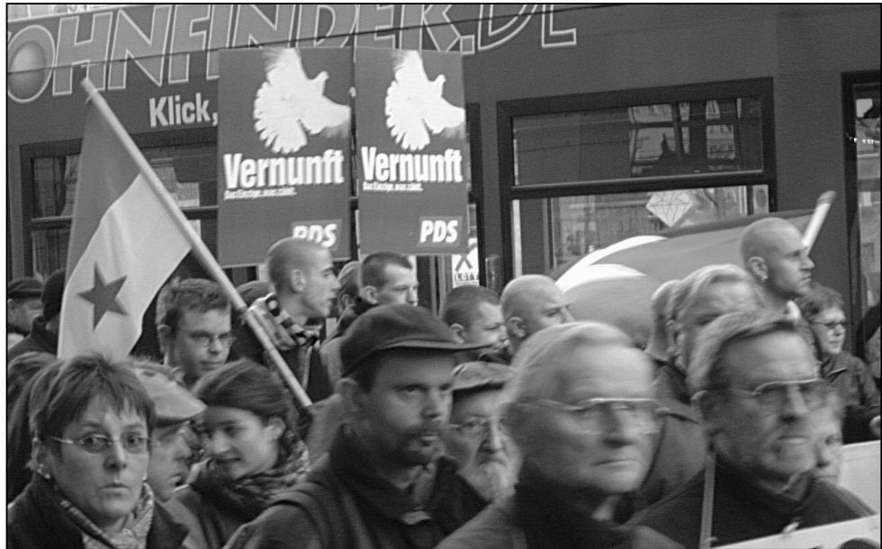
Mit Nazis zur Vernunft?

Was lässt sich nun daraus aber für emanzipatorische Gruppen ableiten? Es ist eine Möglichkeit, sich darüber aufzuregen, ein paar Bier zu trinken und in selbstgerechter Empörung zu baden. Gewaltsame Aktionen gegen das rechte Spektrum widersprechen dem Geist einer Friedensdemo. Eine mögliche