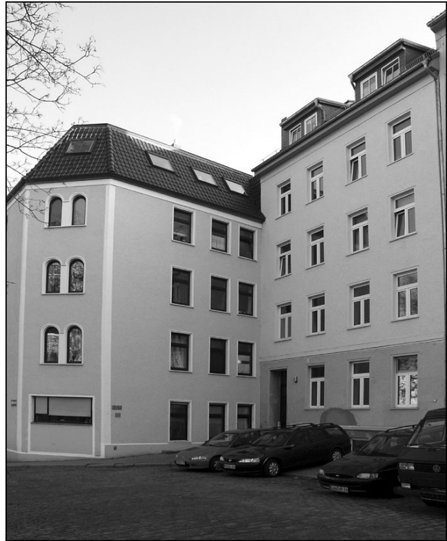
In diesem Gebäude am Fasslochsberg 9 befand sich die Gaststätte „Zur Neuen Welt“, wo 1927 der Kongress der FKAD stattfand.

In der Zeit nach 1924 kam es zu einem Abflauen der revolutionären Bewegungen, was sich auch in einem deutlichen Nieder-