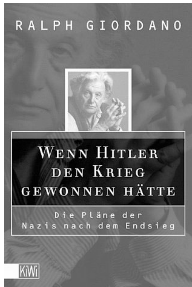
Giordano, Ralph: Wenn Hitler den Krieg gewonnen hätte. Die Pläne der Nazis nach dem Endsieg, Kiepenheuer&Witsch, Köln, 2000. ISBN 3-462-02944-4. Preis 24,90 DM.

beit. Inhaltlich kann man ihn also kaum widerlegen. Er moralisiert auch nicht, also kann der liebe Walser ihm auch nicht den Gebrauch der Faschismuskeule vorwerfen. Dadurch dass er dann schließlich auch noch ganz unaufgeregt darlegt, welche überaus starken Parallelen neoliberales „Wirtschaft, Wirtschaft über alles“-Gedankengut zu den ökonomischen Konzepten der NS-Zeit bestehen, kann man ihm noch nicht mal vorwerfen, er behandle ein Thema, das ja schon längst erledigt und vergessen sei. Vielleicht sollte man mal Merz, Möllemann, Koch oder Schill fragen. Die Jungs haben ja Erfahrung, wie man mit solchen Nestbeschmutzern umgeht.