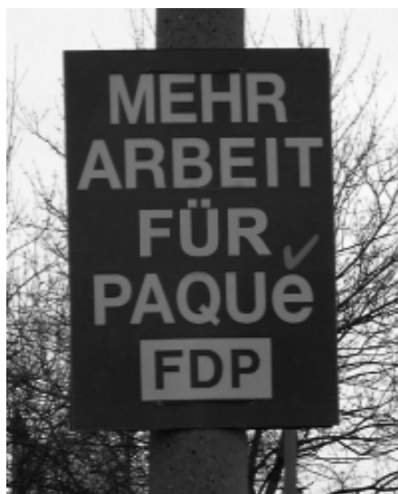
Die geplagten Studenten werden sich freuen...

an das Märchen von einer FDP, die in Wirtschaft und Bildung besonders fähig wäre. Schaut man sich die Bilanz der Ministerien