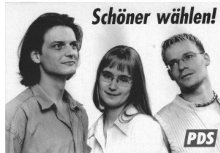
Die PDS wird modern - Wahlaussagen von beeindruckender Schlichtheit!