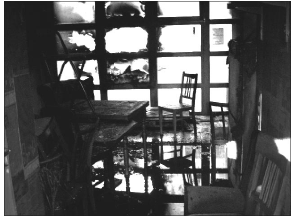
Das „Thiembuktu“ nach dem Anschlag.

Unterstützung der BauBeCon, die Hilfe der Buckauer BürgerInnen und die Zusage Magdeburger Bands für ein Benefizkonzert zur Wiederinstandsetzung des „Thiembuktu“.