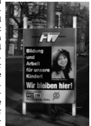
Jetzt soll'n schon unsere lieben Kleinen arbeiten?!