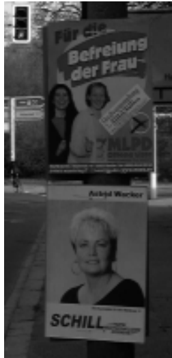
Liebe Stalinfans! Bei Frau Schill macht ihr bitte 'ne Ausnahme?!

nicht aufzuweisen und bundespolitisch haben CDU-Leute von hier keinen nennenswerten Einfluss. Spitzenkandidat Böhmer verfügt über keinerlei Medienkompetenz und ist selbst in S-A wenig bekannt. Die klassischen Themen der CDU, Wirtschaft und Sicherheit, werden in diesem Wahlkampf auch von allen übrigen Parteien besetzt. Wenn die CDU Wahlsieger in S-A wird, dann eher wegen der Schwäche anderer Partei-