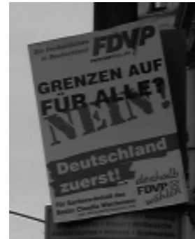
Selbst beim Grenzen öffnen soll Deutschland wieder den Anfang machen!

Weitere Infos unter 030-61625909 oder www.summercamp.squat.net