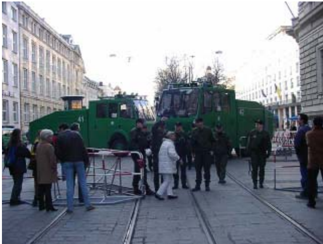
München begrüßt seine Gäste...

kämpfte die Polizei auch die leeren Transparente (Fakeaktion) nieder und hatte auch keinen Sinn für Spaß(aktionen).